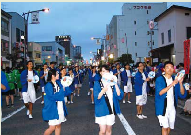
◆ 北上みちのく芸能まつり市民パレード