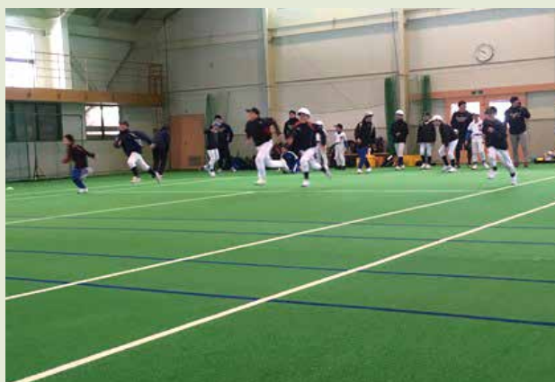
◆ 当金庫野球部による野球教室 (平成29年度は北上市・西和賀町の各地区において計4回開催)

きたしん会(きたしん会・信和会・西和賀しんきんクラブ・北上駅前しんきん友の会)・はばたきの会・ほほえみの会・きたしん健康友の会等を組織して、ゴルフ大会、ゲートボール大会、親睦旅行など様々なイベントを開催しております。