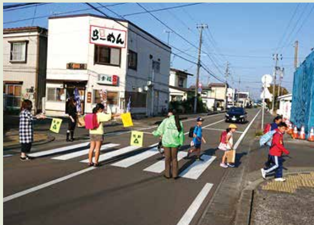
◆ 春・秋の交通安全街頭指導