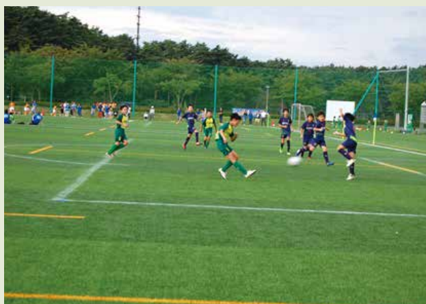
◆ 第15回 北上信用金庫杯少年サッカー大会