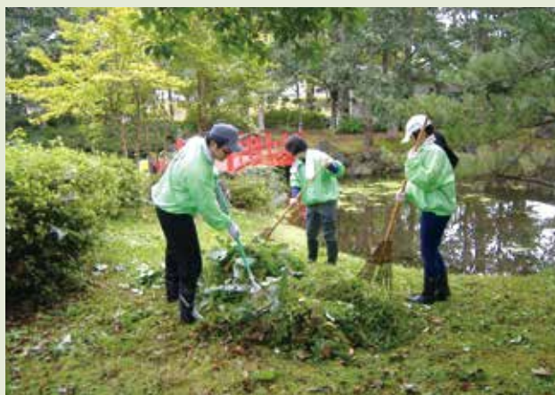
◆ 各種ボランティア活動（佐野公園草刈作業のお手伝い）