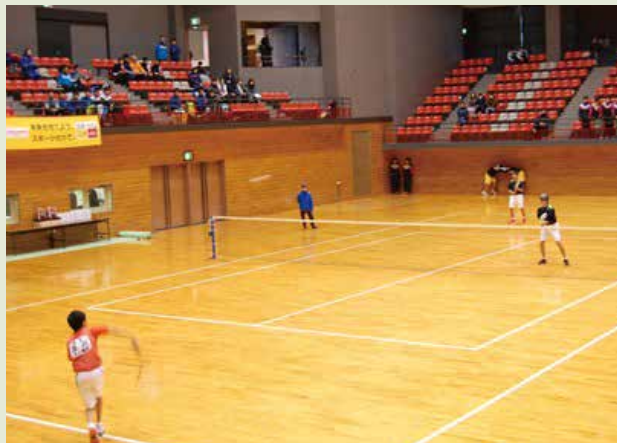
◆ 第17回 北上信用金庫杯ソフトテニス大会