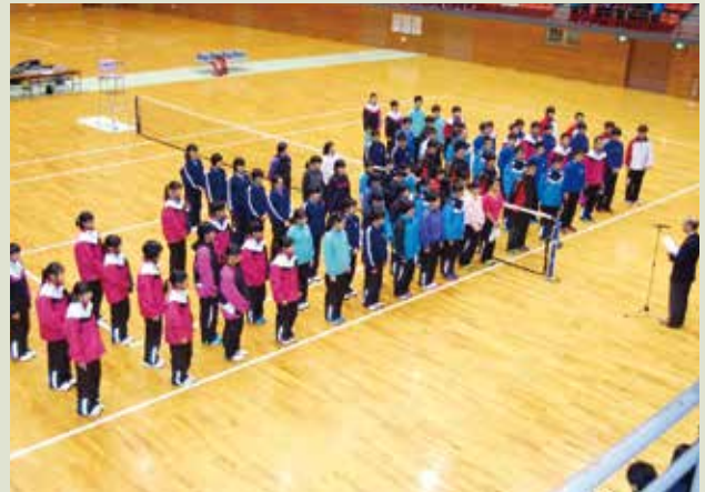
◆ 第16回 北上信用金庫杯ソフトテニス大会