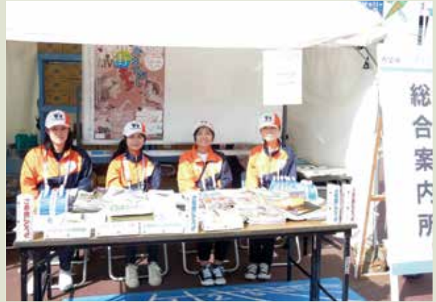
◆ 岩手国体・いわて大会2016