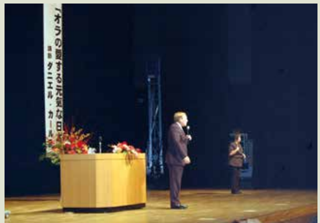
◆ 第23回 きたしん文化講演会

きたしん会(きたしん会・信和会・西和賀しんきんクラブ・北上駅前しんきん友の会)・はばたきの会・ほほえみの会・きたしん健康友の会等を組織して、ゴルフ大会、ゲートボール大会、親睦旅行など様々なイベントを開催しております。