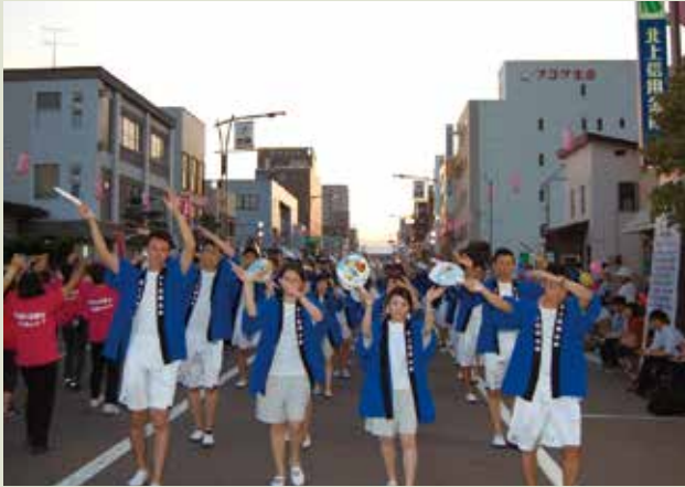
◆ 北上みちのく芸能まつり市民パレード