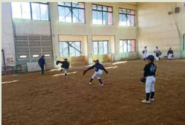
◆ 当金庫野球部による野球教室 (平成28年度は北上市・西和賀町の各地区において計6回開催)