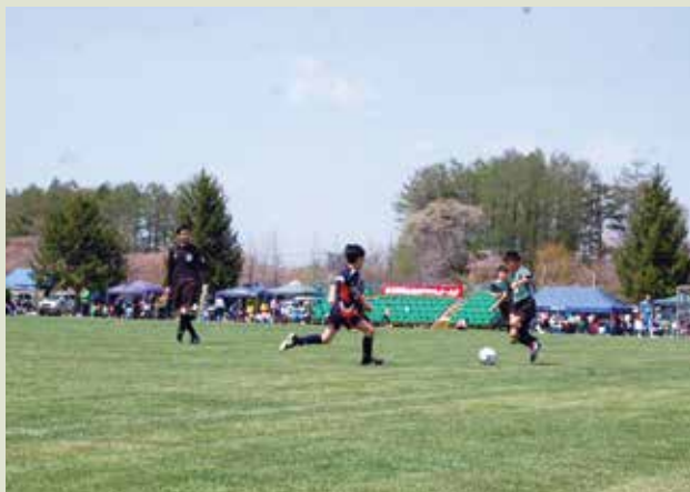
◆ 第14回 北上信用金庫杯少年サッカー大会